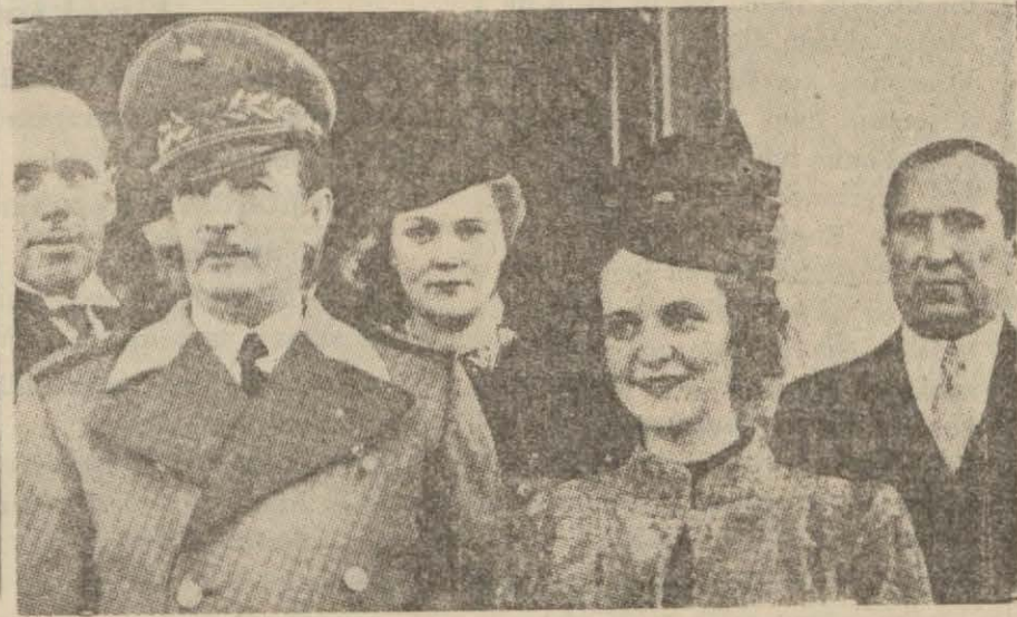
Kral Zogo ile Kraliçenin ve hemşirelerinin Paristeki La May şatosunda alınmış bir resimleri

Eski Arnavud Asilzadelerinden Biri Kraldan Soyadını Değiştirmesini İstiyor