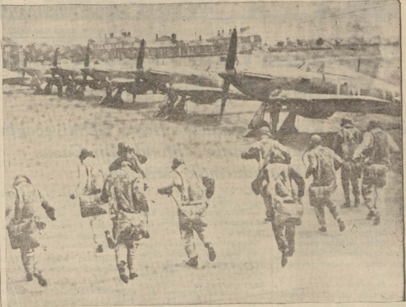
Hareket emrini alan tayyareciler tayyarelerine koşuyorlar

Telefon çaldı ve bütün tayyare karargâhlarına aynı emir verildi: Hareket ediniz!