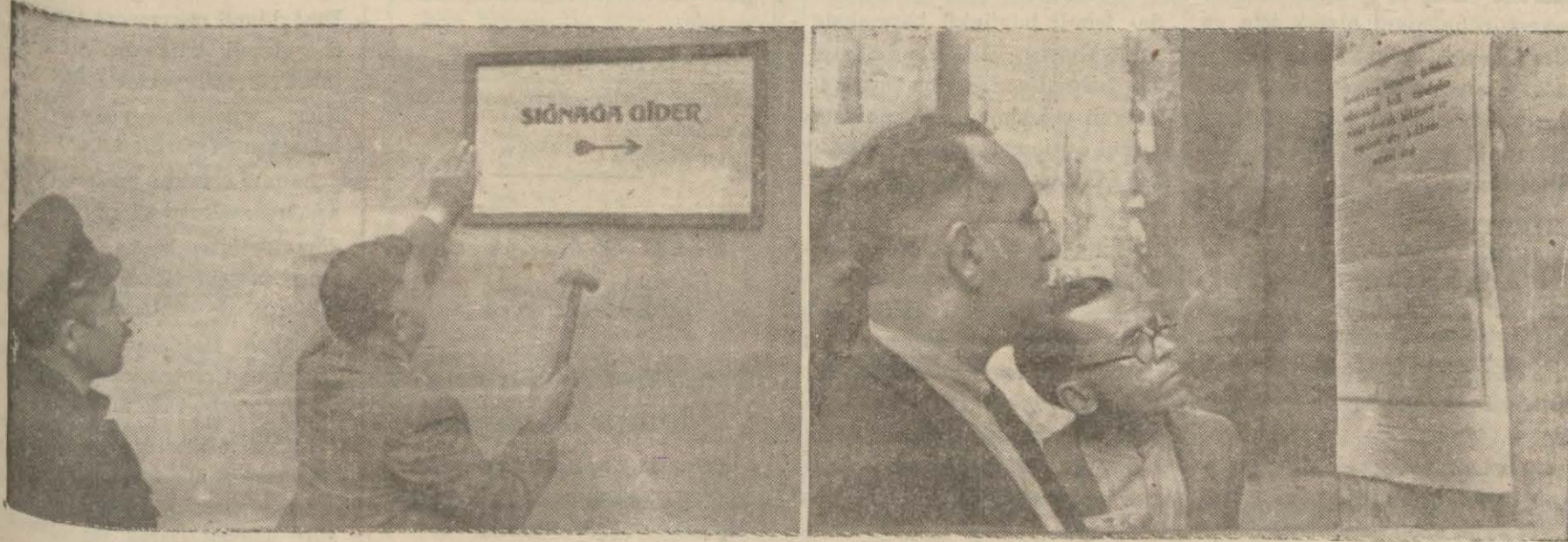
Şehrimizde hava hücumlarına karşı pasif müdafaa hazırlıkları

İlk Tayyare H¼cümünün Bu Hafta İçinde Geceleyn Yapılacağı Zannedilmektedir