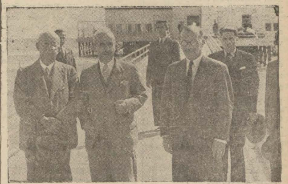
Milli Şefimiz Floryada

Milli Şef, Bu Gün Deniz Köşkünde Başvekili Kabul Etiler