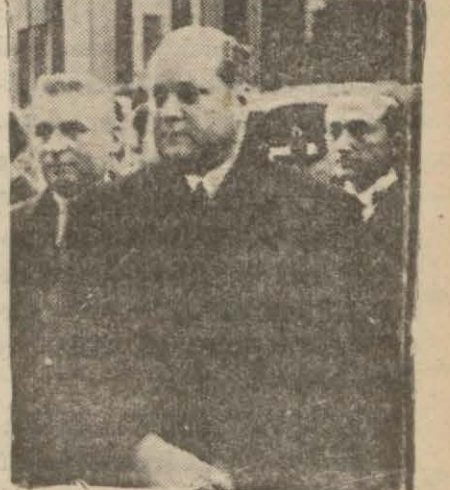
Bulgar Başvekili Köseivanof

Romanya ve Polonya da Mukabil Tahşidat Yapıyorlar